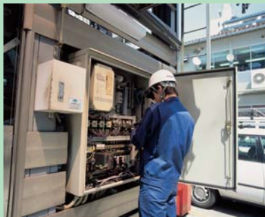
定期メンテナンス